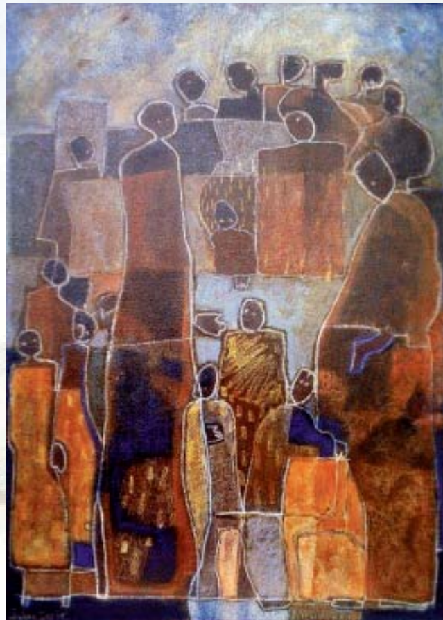
Sinon sansquoi et les autres 2004