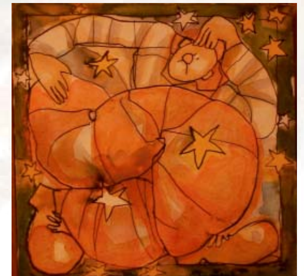
Cirque couleur dec. 2007

Il libro viene pubblicato in Italia dall'editore Le Brumaie nel 2008.