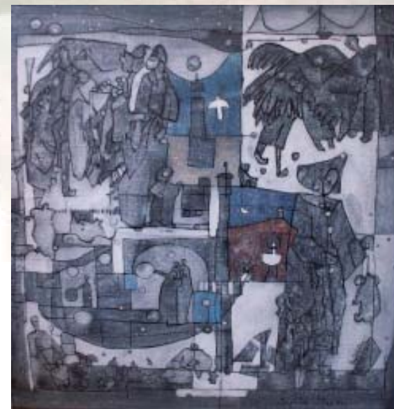
La petite ourse Lyon 2007