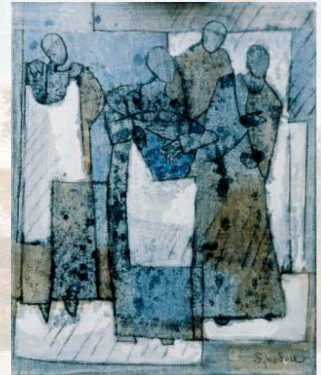
Les souks lecture