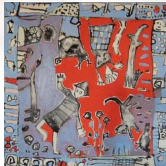
À la folie

Potrete trovare le modalità per l'acquisto dei volumi ed ogni ulteriore informazione sul sito: www.lebrumaieeditore.it oppure scrivendo a: direct@lebrumaieeditore.it