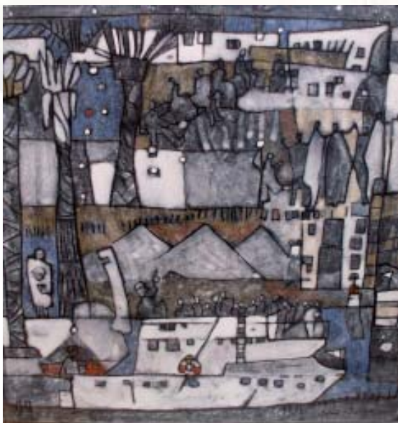
Croisière sur le nil (détail) Lyon 2007

regione delle Ardenne. Fin da molto giovane si appassiona di arte e danza e partecipa come autodidatta a numerosi ateliers di pittura. Dal 1981 vive e lavora nel sud della Francia tra Tolone e Marsiglia. Frequenta les Beaux Arts di Tolone e si applica alla tecnica del disegno in diretta, facendo molti schizzi di paesaggi e persone, cercando di riprodurre l'energia che si propaga dai soggetti stessi.