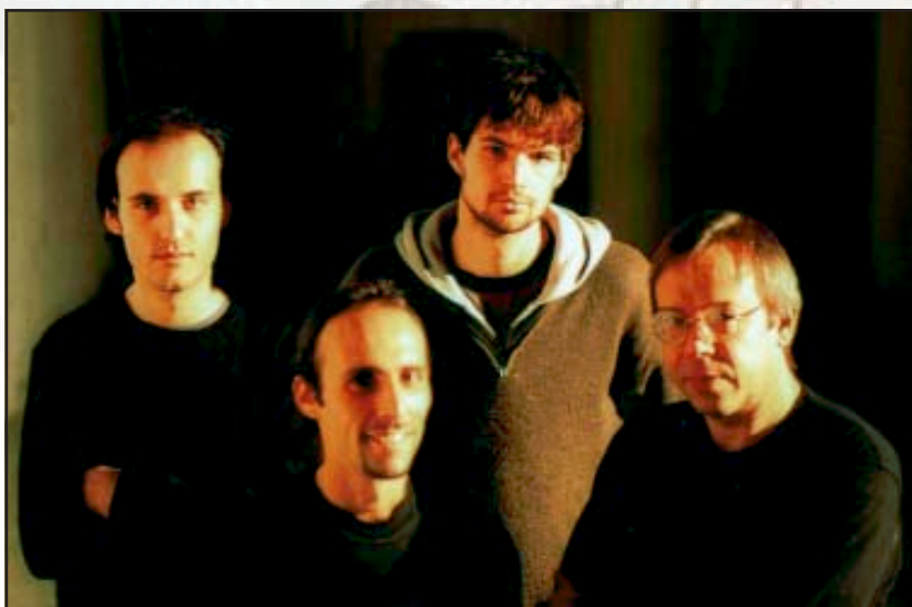
Il gruppo, GLI EDGELESS

Nell'estate 2006 ha suonato al Festival di Stresa nel quartetto di Emanuele Cisi. Nello stesso periodo incide il secondo cd con il suo gruppo "Edgeless", dal titolo " Matassa ", prodotto da Michele Generale per la DDErecords , in cui il sound del quartetto si orienta verso sonorità latine e fusion con brani più articolati sia suoi che di Alessandro Chiappetta .